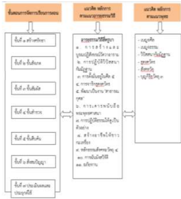
แผนภาพที่ 13 แสดงภาพการบูรณาการหลักอารยธรรมเพื่อการเรียนการสอนในสถานศึกษาในจังหวัดลำพูน

เนื่องจากพื้นฐานของครอบครัว ชุมชน มีการประพฤติปฏิบัติและการสั่งสอน ทั้งทางตรงและทางอ้อมจากพ่อแม่ คนเฒ่าคนแก่ในชุมชน ที่ได้สั่งสอนเกี่ยวกับคำสอนของครุบา ในการ ถือศีล กินเจ ซื่อสัตย์สุจริตไม่เบียดเบียนผู้อื่น