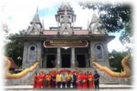
แผนภาพที่ 7 แสดงภาพการสนทนาคณะ

การปฏิบัติที่มีเอกลักษณ์ แต่มีเป้าหมายเดียวกันคือการอุทิศตนเพื่อพระพุทธศาสนา และถือนั่นอยู่ในวิถีแห่งธรรมอย่างแน่วแน่มั่นคง ได้สร้างศรัทธาจากธรรมะปฏิบัติของท่าน เป็นแบบอย่างที่ดีแก่พุทธบริษัทและพระเถระทั่วไป ด้วยความมั่นคงในการบำเพ็ญสมณะวิปัสสนากัมมัฏฐาน จนเป็นที่เลื่องลือสักกะลาทั่วไปในหมู่ชาวล้านนาด้วยการพัฒนาดังต่อไปนี้