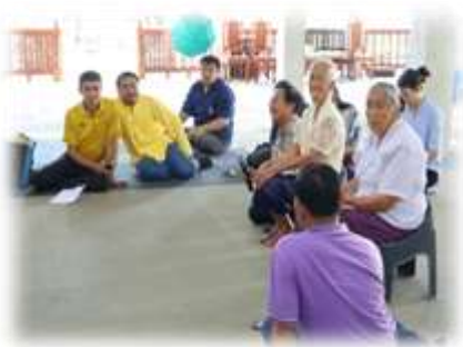
หลานของครูบาศรีวิชัย แห่งวัดบ้านปาง จังหวัดลำพูน