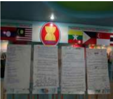
แผนภาพที่ 6 แสดงภาพการเปรียบเทียบอารยธรรมของ 4 ครุบาในจังหวัดลำพูน

สถานที่ดำเนินโครงการ การสำรวจออกแบบและประมาณการค่าใช้จ่ายในการดำเนินโครงการ การสมทบวัสดุน้ำมันเชื้อเพลิงสำหรับใช้กับเครื่องจักรกลขององค์การบริหารส่วนจังหวัดลำพูน และบทบาทของผู้นำท้องถิ่นในจังหวัดลำพูน เป็นแกนหลักในการประสานงานระหว่างองค์กรปกครองส่วนท้องถิ่นในพื้นที่กับประชาชน เป็นผู้รับผิดชอบหลักร่วมกับประชาชนในการดำเนินโครงการ การร่วมกันคิด ร่วมกันวางแผน ร่วมสมทบทุน ร่วมแรงงาน ร่วมใจ ร่วมรับผลประโยชน์ และร่วมติดตามตรวจสอบจนโครงการนั้นบรรลุผลสำเร็จตามเป้าหมาย