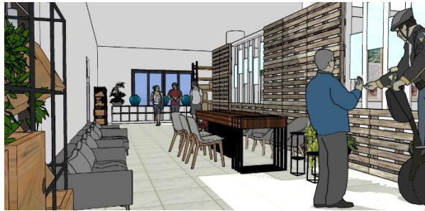
ภาพลายเส้นที่ 2 ลักษณะของการออกแบบบริเวณด้านจุดลงทะเบียน

การจัดแสดงนิทรรศการในอาคารพิพิธภัณฑ์ ทำการแบ่งสัดส่วนพื้นที่ห้องจัดแสดงนิทรรศการให้แยกจากกัน โดยแบ่งเป็นห้องนิทรรศการ ตามหัวเรื่องของการออกแบบจัดแสดงนิทรรศการ เนื่องจากบริเวณตรงกลางของอาคารมีเสาเป็นจำนวนมาก จึงไม่เหมาะที่จะทำเป็นทางเดิน โดยในการแบ่งกันห้องนิทรรศการจะใช้ผนังเบาหรือสมาร์ทบอร์ด เป็นตัวกั้นเพื่อแบ่งพื้นที่ห้องนิทรรศการ